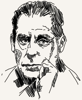
Walter Gropius (1883 - 1969)

Das Bauhaus wurde 1919 von Walter Gropius in Weimar gegründet. Ziel war es, Kunst, Handwerk und Technik zu vereinen und eine neue, funktionale Gestaltung zu schaffen. Im Mittelpunkt standen soziale Aspekte und die Idee, gutes Design für alle zugänglich zu machen. Das Bauhaus wurde so zu einer der wichtigsten Bewegungen der modernen Kunst und Architektur.