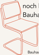
Bauhaus Design (freischwinger Stuhl)

Der Bauhausstil prägt bis heute Kunst, Design und Architektur. Viele moderne Gebäude, Möbel und Alltagsgegenstände orientieren sich an seinen klaren Formen und funktionalen Ideen. Auch bekannte Künstler und Designer des Bauhauses beeinflussen noch heute Gestaltung weltweit. Das Bauhaus steht somit für eine zeitlose Lebensweise.